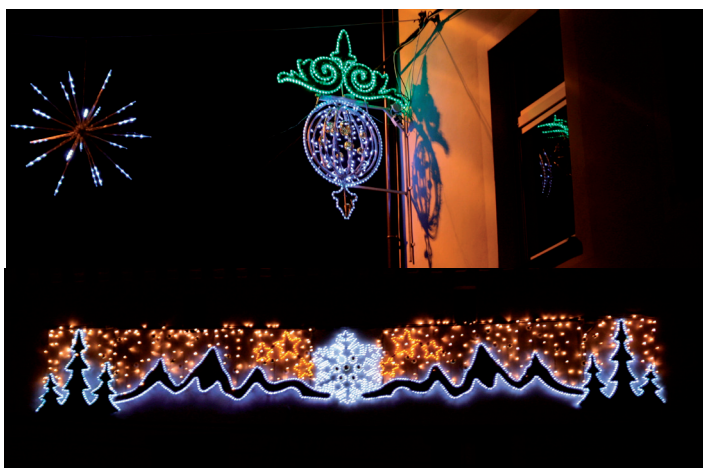
Dekoracje budynków w Brzezince

Ś wietlisty anioł grający na trąbce, a za nim wypełnione prezentami sanie zaprężone w renifery. W tle iskrząca się setkami światełek kapliczka św. Jana Chrzciciela. Ten przepiękny wystrój na starówce (i nie tylko) zafundował mieszkańcom MZGK.